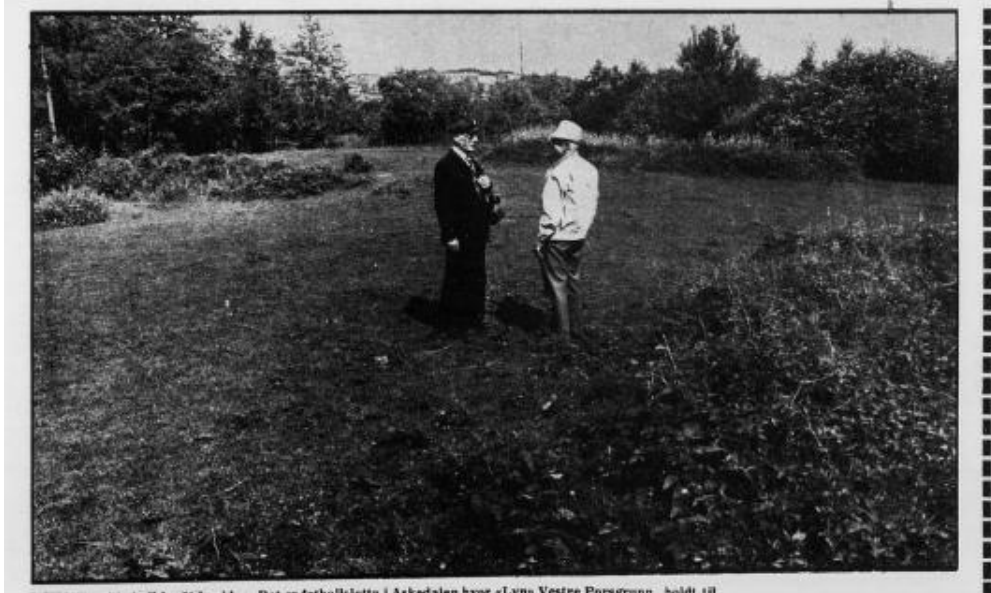
Her spilte vi fotball for 70 år siden. Det er fotballsletta i Askedalen hvor «Lyn» Vestre Porsgrunn holdt til.

Lyn var navnet på klubben fram til 1914.